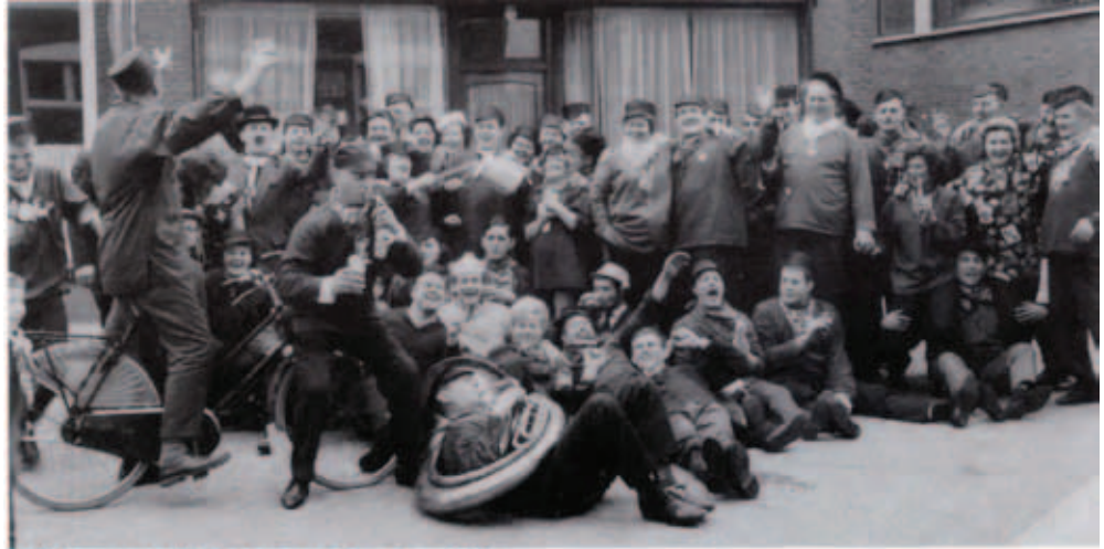
De Brassers op Rosenmontag in het jaar 1966.

30.01. Het 33-jarig bestaan van CV De Brassers, dat elk jaar het Blaaskapellenfestival verzorgt. Receptie en feestavond in Zaal Apollo. De eigen Hebraskapel bestaat inmiddels ook al weer twintig jaar. Zij fungeert tevens als Hofkapel op de zittingen van CV De Teuten in Bergeijk. De kapel voert met carnaval de 'Rosenmontag' in en bezoekt dan diverse kroegen: de zogeheten 'Elfkroegentocht'.